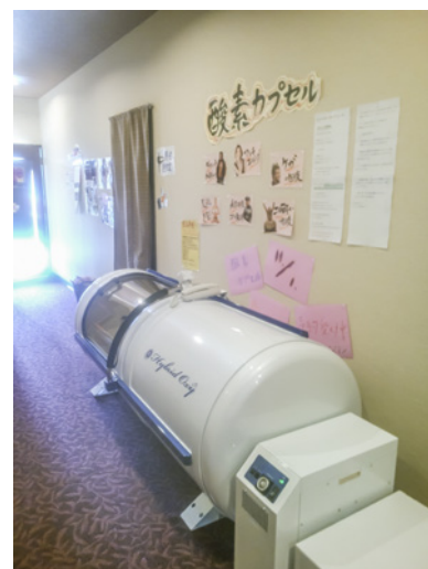
▲豊田スタジオの酸素カプセル